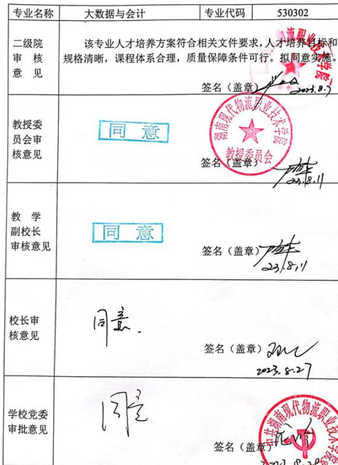
附表7 专业人才培养方案审批表